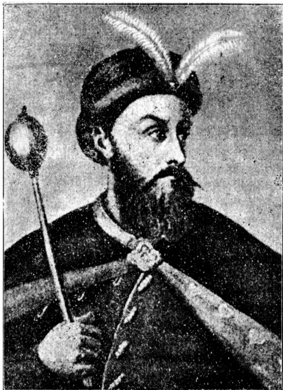
Гетьман Петро Дорошенко.