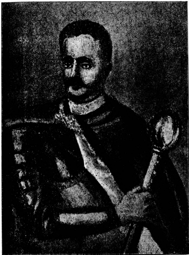
Гетьман Іван Мазепа.