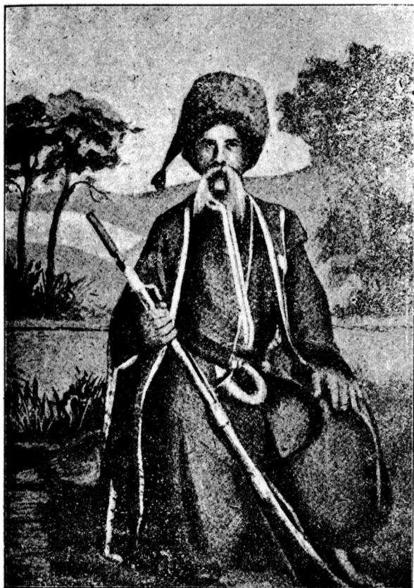
Чорноморський козак із перших часів.