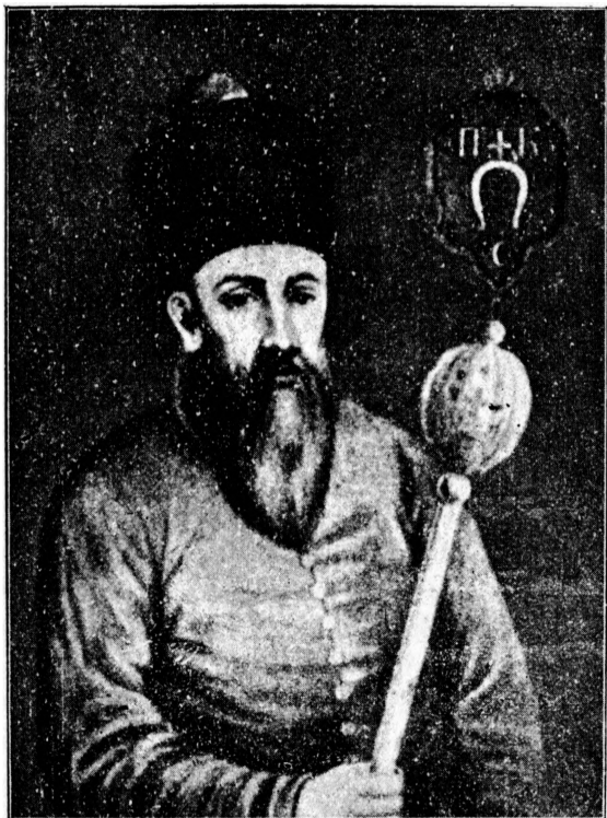
Гетьман Петро Конашевич Сагайдачний.