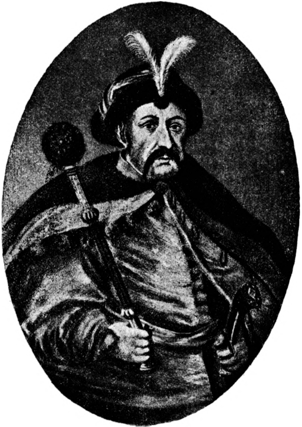
Гетьман Богдан Зиновій Хмельницький.