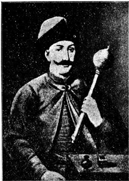
Гетьман Іван Виговський.