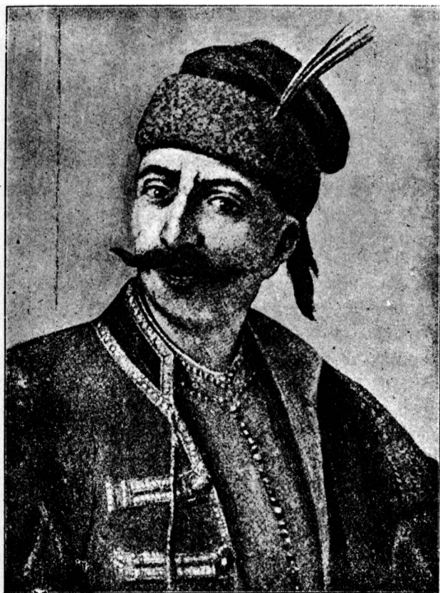
Сотник Іван Гонта.