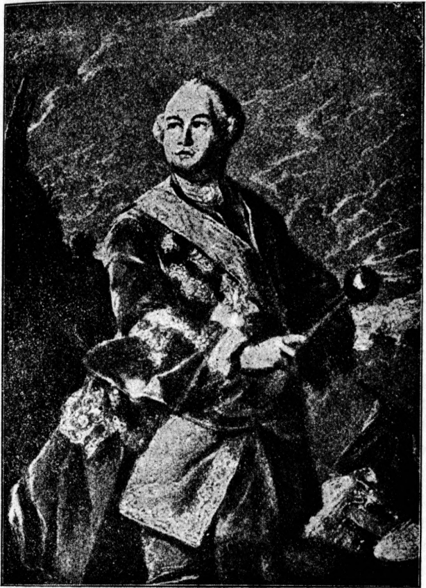
Останній Гетман України Кирило Розумовський.