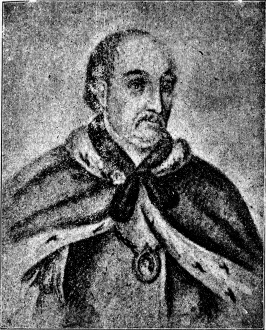
Гетьман Іван Скоропадський.