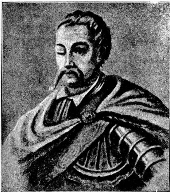
Гегъман Данило Апостол.