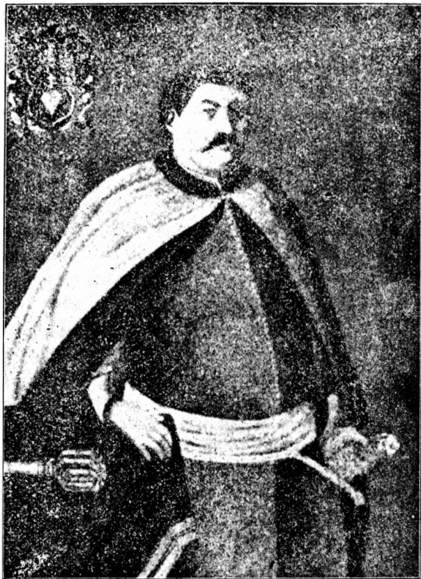
Наказний гетьман Павло Полуботок.