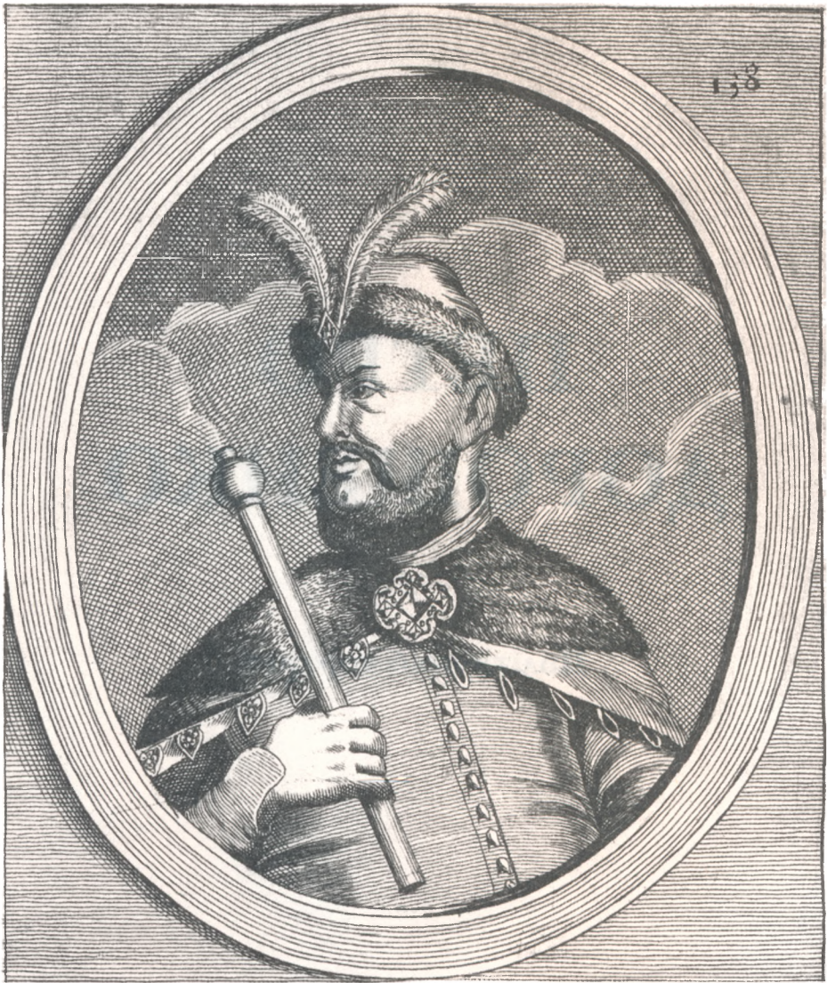
PIETRO DOROZENKO GENERALE DE COSAC- CHI ZAPOROVYENSI .