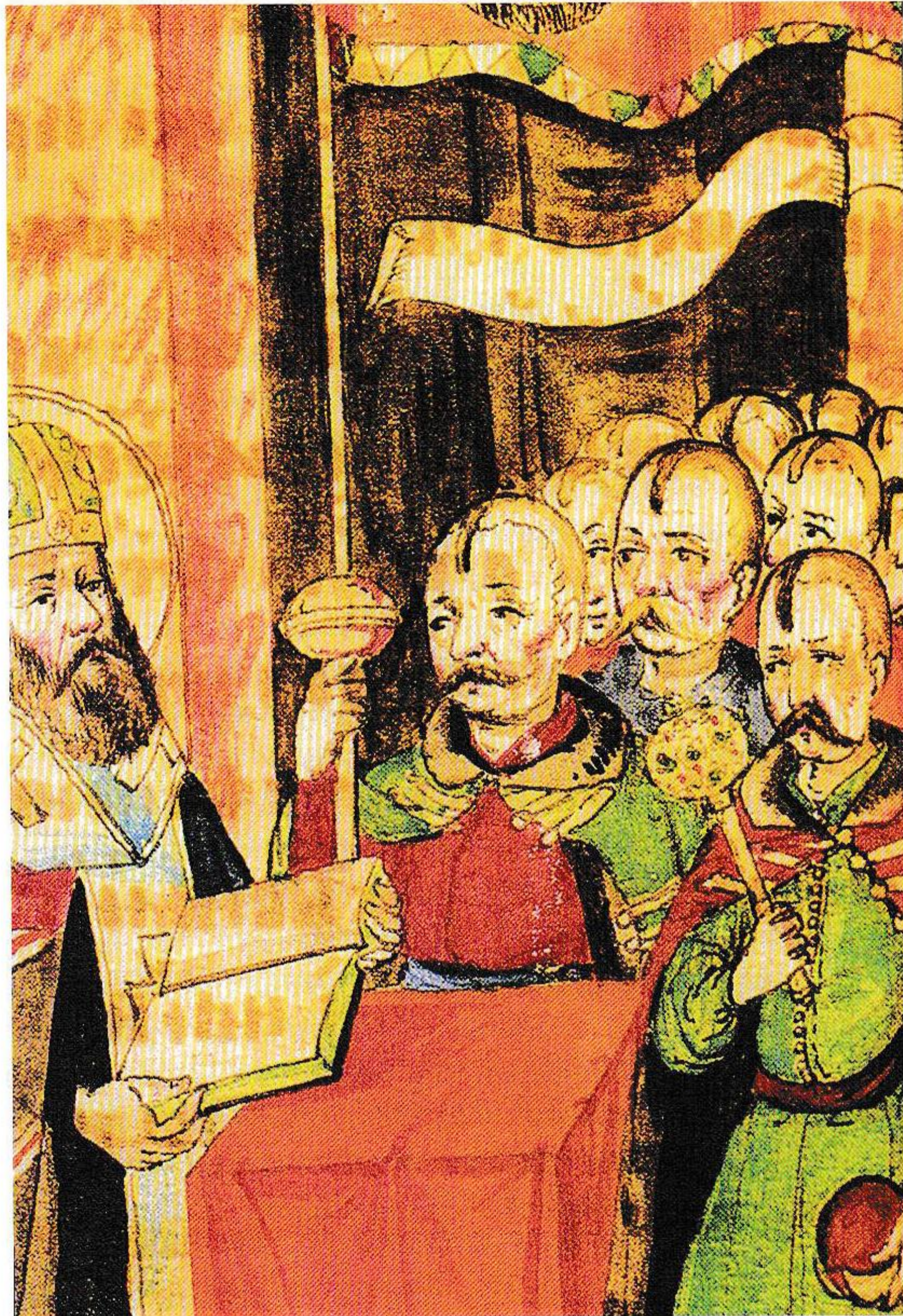
Освячення козацьких клейнодів у церкві. Мініатюра з книги Лазаря Барановича «Службник». 1665 р.

ради, треба оцінити міжнародне становище ново-посталої у геополітичному просторі Європи Української держави. Перебуваючи у «силовому полі» боротьби за першість між Річчю Посполитою, Московським царством та Османською імперією (включно з Кримським ханатом), правителі гетьманства, які з 1654 р. відмовилися від польсько-литовського сюзеренітету, вимушені були визнавати