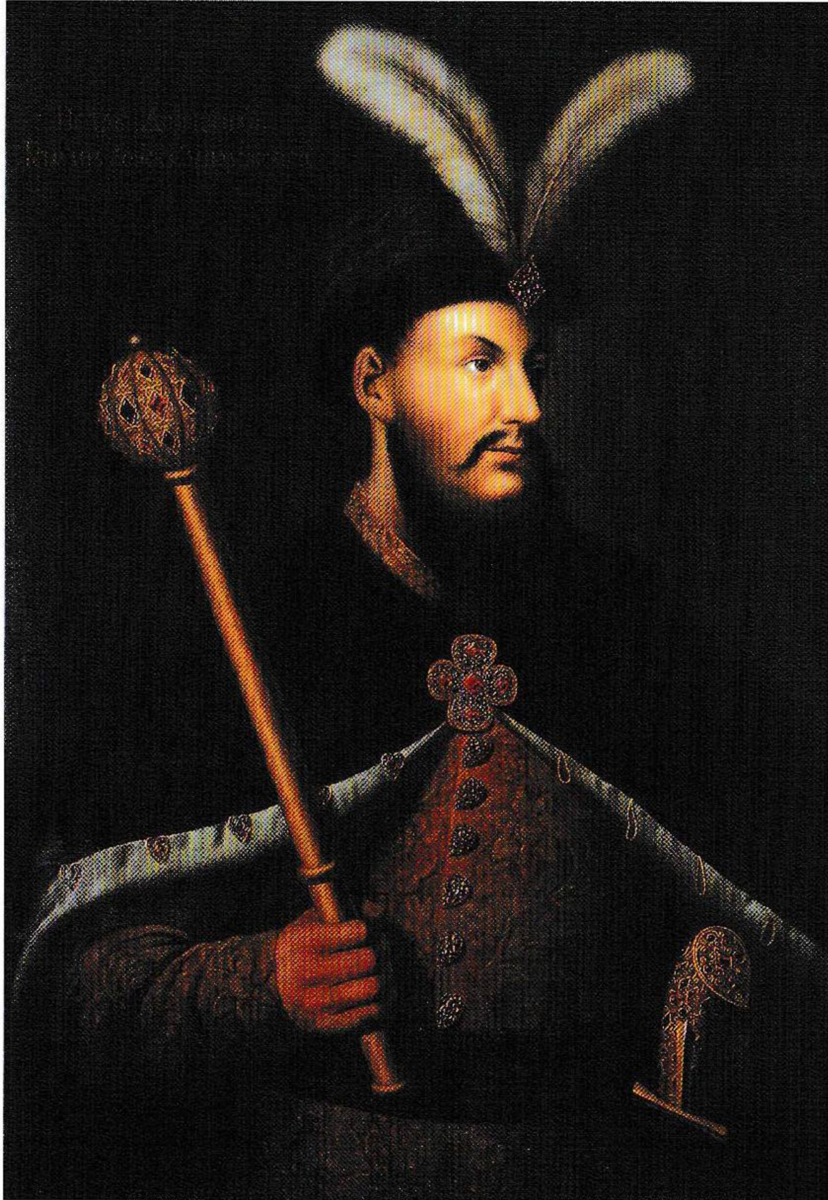
Портрет гетьмана П. Дорошенка. Невідомий художник. Олія. Друга половина ХІХ ст.

в історії ранньомодерної України козацька старшина присягнула своєму гетьману в тому, щоб «в послушенстві його залишатися». Одночасно українцями була складена й присяга на вірність королеві Речі Посполитої, а також, щоб «мешкати у згоді й приязні» з кримським ханом.