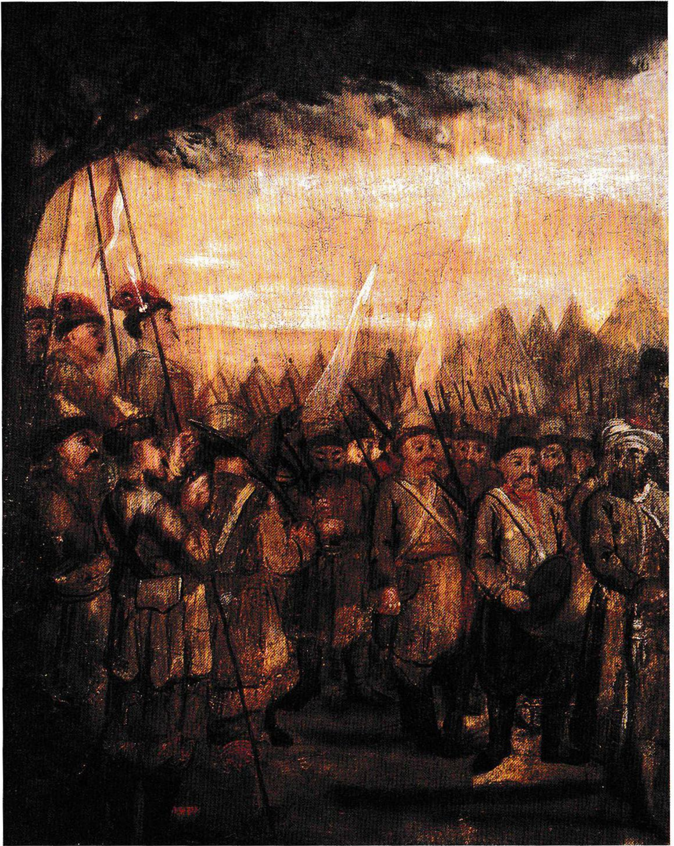
Похід козацької піхоти. Картина невідомого художника з Музею Війська Польського у Варшаві. XVIII ст.

про час і місце проведення польсько-української мирної комісії з вироблення окремої угоди та запропонувати якнайшвидше її проведення. Окрім того, вони мали отримати королівську резолюцію