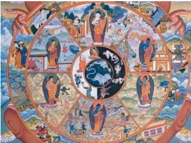
Символічна схема буддизму

Якщо абстрагуватися від легенди, можемо дізнатися, що Будда пройшов довгий шлях навчання. Він ретельно вивчав усі відомі на той час філософські погляди й запропонував відмовитися від пошуку відповідей на запитання: чи вічним є світ? Як співвідносяться душа і тіло? Чи є безсмертним той, хто пізнав істину? Запропонована Буддою істинна поведінка ґрунтувалася на чотирьох основних істинах, восьмискладовому шляху звільнення, законі взаємного виникнення та трьох засадничих характеристиках буття — несталості, безособистісності та незадоволеності.