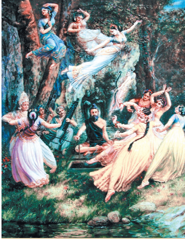
Чарвака-локаята: «Насолоджуйся життям, поки живий!»

аніж ходити і тим самим знищувати комашок); правдивість; не вкради; утримання від спокуси; утримання від уподобань до чуттєвих об'єктів.