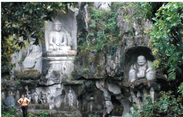
Найвідоміший буддистський монастир Китаю — Шаолін

Філософія буддизму дає можливість кожній людині усвідомити здатність індивідуального духовного зростання та удосконалення через дотримання послідовності проходження морально-етичних ступенів. Буддизм спрямований на активне практичне застосування та вирішення проблем людини в період її життя, а не колись на небесах. Вона спроможна впливати на перебіг подій свого життя.