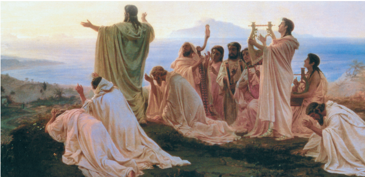
Піфагорійці, які поклоняються Сонцю

Кожен мислитель уважав, що має право сам дошукуватися до істин, змінювати й виправляти існуюче знання, що сприяло його вільному розвитку. Єгиптяни, а потім греки впродовж декількох століть заклали основи багатьох галузей науки: астрономії, геометрії, медицини, фізики, біології, історії, що об'єднувалися філософським началом і були спочатку лише певними напрямками філософії. Знання почали доводити й перевіряти, тобто будувати раціонально, у логічно розробленій системі понять. Стародавня Греція стала батьківщиною науки.