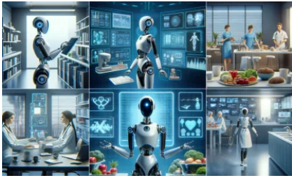
10 найкращих помічників AI (липень 2024)