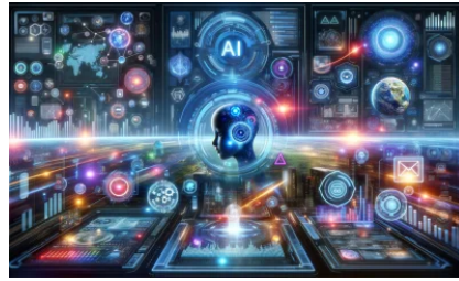
10 найкращих маркетингових інструментів ШІ (липень 2024 р.)