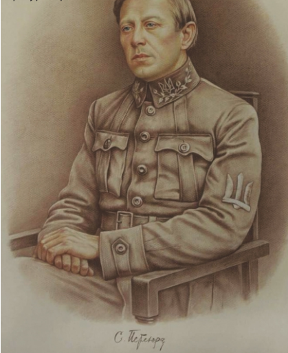
Головний Отаман військ і флоту УНР Симон Петлюра. Робота художника Артура Орльонова