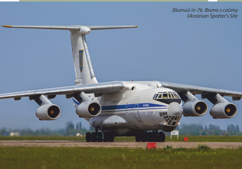
Збитий Іл-76.

5 липня – звільнення від бойовиків Гірки на Слов'янська. Після невдалих спроб визволити Слов'янськ 13 і 24 квітня сили АТО розпочали облогу, звужуючи кільце оточення. Основні бої точилися на блокпостах за контроль над комунікаціями. Проти терористів була застосована авіація. 3 червня знищено укріпрайон бойовиків у Семенівці, а 1 – 4 липня сили АТО визволили низку передмість, зокрема Миколаївку.