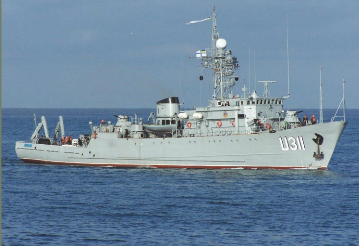
Морський тральщик ВМС України «Черкаси».

24 березня – російський спецназ захопив 1-й окремий батальйон морської піхоти (Феодосія), який був останньою українською військовою частиною наземного базування у Криму. Також у цей день в Донуз-