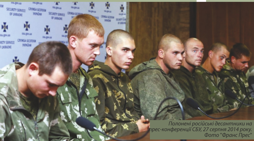
Полонені російські десантники на прес-конференції СБУ, 27 серпня 2014 року.

23 серпня – масове вторгнення на територію Донецької та Луганської областей регулярних підрозділів ЗС РФ. Зафіксовано 8 батальйонно-тактичних груп,