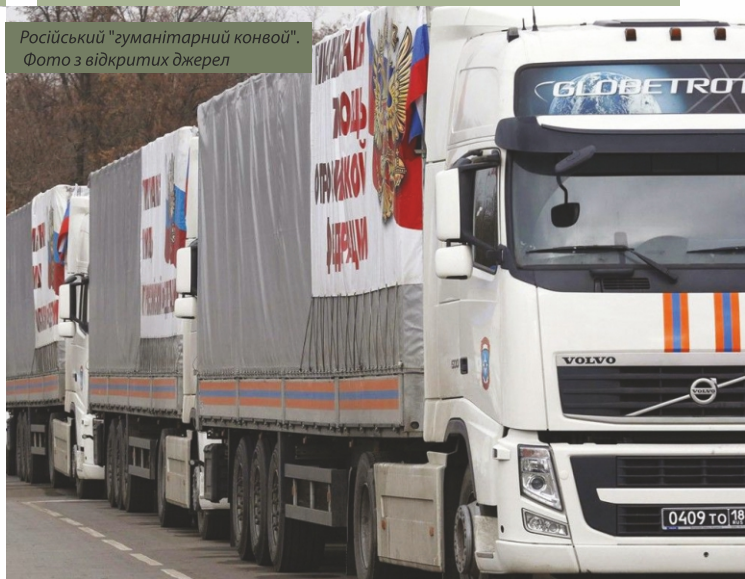
Російський "гуманітарний конвой".

бойці почали зачистку Мар'їнки у східному та західному напрямках.