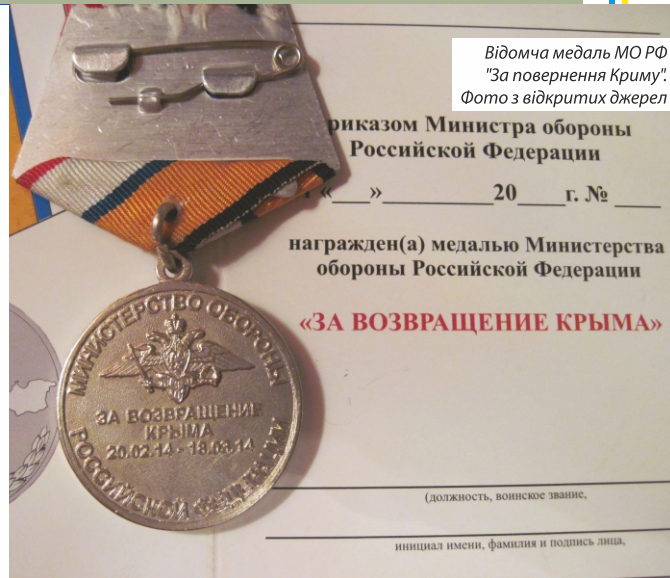
Відомча медаль МО РФ "За повернення Криму". Фото з відкритих джерел