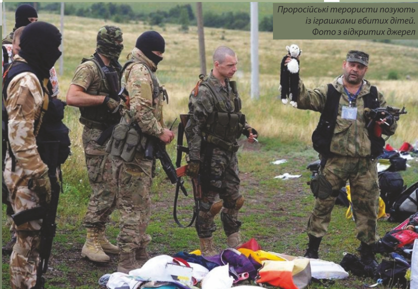
Проросійські терористи позують із іграшками вбитих дітей.

21 липня – звільнення Рубіжного. У липні сили АТО розпочали операцію з визволення Лисичансько-Сіверодонецької агломерації Луганської області.