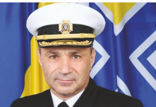
Командувач ВМС адмірал Ігор Воронченко.

1991 року Україна нарешті здобула незалежність. Проте Російська Федерація не полишає спроб відновити контроль над Україною та колишніми республіками СРСР. Через розмивання української національної ідентичності, маніпуляції навколо мовного питання, гіперболізацію регіональних особливостей, заперечення права українців на відновлення національної пам'яті, фінансування та вербування українських політиків, впровадження своїх агентів у безпекові інституції країни Росія постійно впливала на політичний ландшафт України.