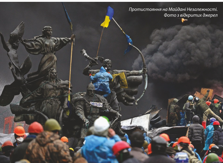
Протистояння на Майдані Незалежності.

Очевидно, як тільки будь-яка країна, що її РФ за- раховує до своєї зони впливу, починає дипломатич- но зближуватися з Європейським Союзом чи Спо- лученими Штатами Америки, Росія використовує всі методи для відновлення проросійського курсу. І, в разі невдачі, Росія не боїться застосувати регу- лярну армію чи найманців для вторгнення і нав'я- зування свого бачення розвитку суверенної країни.