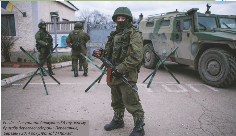
Російські окупанти блокують 36-ту окрему бригаду берегової оборони. Перевальне, березень 2014 року.

вали кримські татари та проукраїнськи налаштоване населення. За оголошеними організаторами результатами, 96,77 % учасників проголосували "за воз'єднання Криму з Росією на правах суб'єкта Російської Федерації". Конституційний Суд України визнав неконституційною постанову Верховної Ради АР Крим, згідно з якою провели референдум.