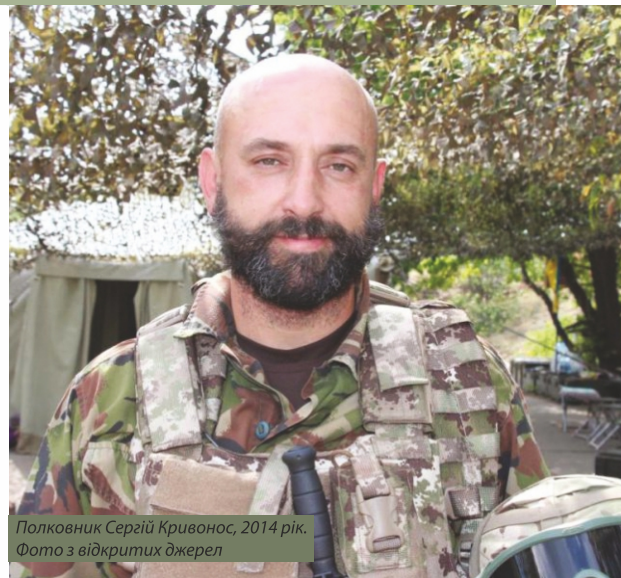
Полковник Сергій Кривонос, 2014 рік.

Початок березня – дестабілізація ситуації учасниками “антимайдану”: захоплені Донецька і Луганська обласні державні адміністрації, проголошені “народні губернатори” областей.