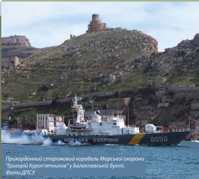
Прикордонний сторожовий корабель Морської охорони "Григорій Куроп'ятников" у Балаклавській бухті.

Початок березня – окупаційні підрозділи РФ