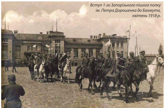
Вступ 1-го Запорізького пішого полку ім. Петра Дорошенка до Бахмута, квітень 1918 р.

У квітні 1918 року з полків Запорізької дивізії (корпусу) Армії УНР під командуванням Олександра Натієва було сформовано дві групи для визволення Криму і Донбасу від більшовиків. Кримська група на чолі з Петром Болбочаном прорвала оборону червоних на Чонгарі та взяла Сімферополь. Кінні частини запорожців дійшли до Бахчисарая та околиць Севастополя. Під впливом успіхів українських військ, 29 квітня кораблі Чорноморського флоту організовано підняли синьо-жовті прапори.