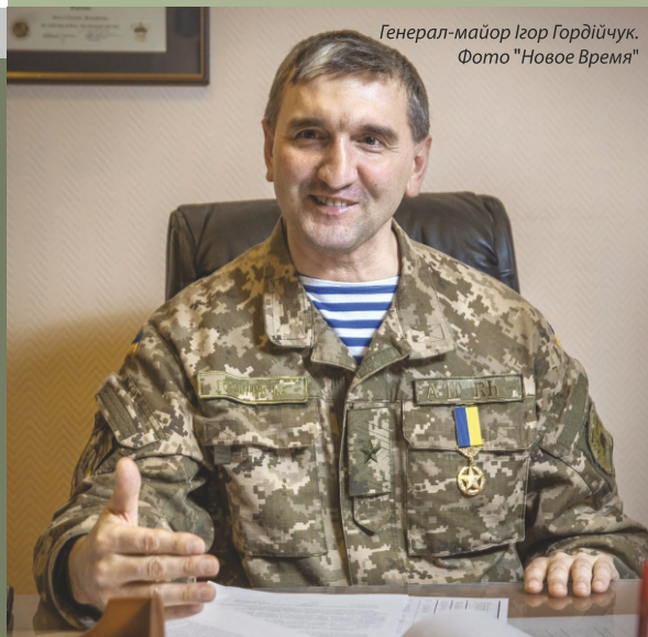
Генерал-майор Ігор Гордійчук.

15 серпня – під час засідання так званої "Ради міністрів ДНР" ватажок терористів Олександр Захарченко заявив про введення резервів у вигляді 30 танків, 120 бронемашин та 1200 одиниць особового складу, які проходили протягом 4 місяців підготування на території РФ.