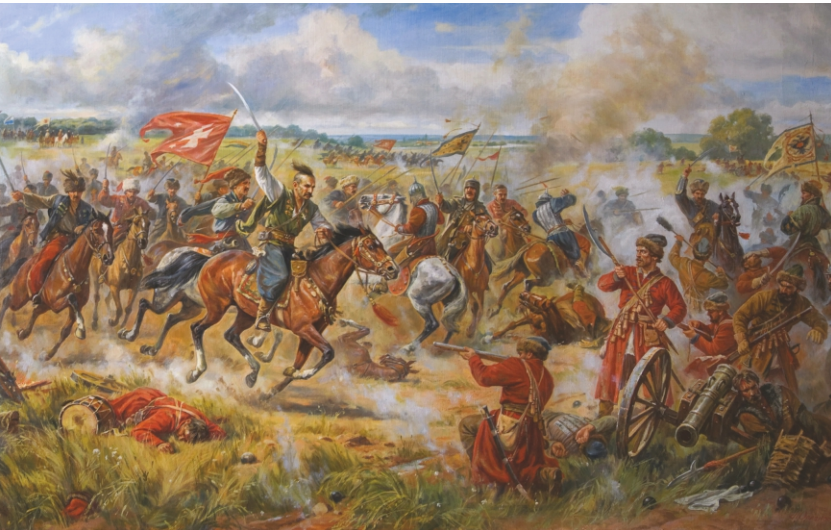
"Конотопська битва". Робота художника Артура Орлюнова

Намагання Мазепи вибороти самостійність завершилася Полтавською битвою 1709 року.