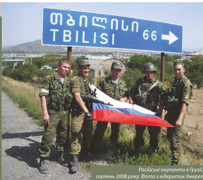
Російські окупанти в Грузії, серпень 2008 року.

Відтоді РФ надає активну військову, економічну та політичну підтримку Придністров’ю, прямо впливаючи на політику Молдови та її зовнішньополітичний курс, уповільнюючи інтеграцію Молдови в ЄС. Наявність російських військових баз і контингенту військовослужбовців у Придністров’ї 2014 року дозволило ГШ ЗС РФ тримати в напрузі Одеську та Вінницьку області України. Генеральний штаб ЗСУ від початку російсько-української агресії розглядає Придністров’я як можливу зону розширення бойових дій.