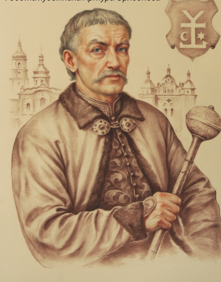
Гетьман Іван Мазера. Робота художника Артура Орльонова