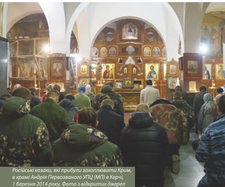
Російські козаки, які прибули захоплювати Крим, в храмі Андрія Первозваного УПЦ (МП) в Керчі, 1 березня 2014 року.

Тому у війську з'являються назви легендарних