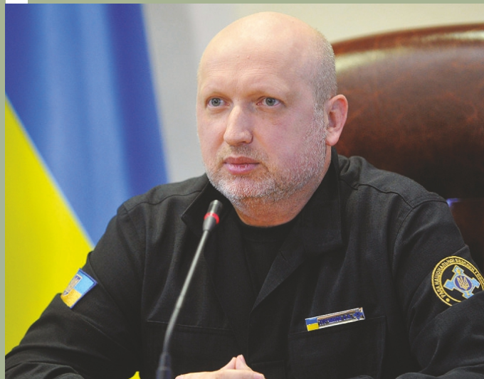
Олександр Турчинов.

23 лютого – у Москві проходив мітинг із закликами до поділу України на три частини, направлення російських “добровольців” для проголошення Малої Росії зі столицею в Харкові. В російській пресі розгорнулася істерія про “незаконну київську хунту” й