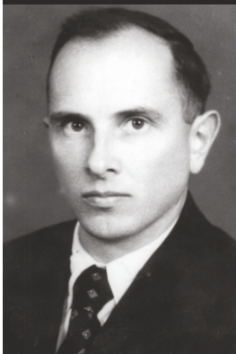
Степан Бандера

а невдовзі – в Організації українських націоналістів (ОУН), Коновалець зібрав ветеранів кампаній Української революції 1917—1921 років, представників емігрантського середовища та молодь. Створені ним УВО та ОУН заклали фундаменти визвольних змагань українців під час Другої світової війни. Соратники і послідовники Коновальця воювали у лавах Української повстанської армії (УПА). УПА виступила проти обох тоталітарних режимів – як проти нацистського, так і проти комуністичного.