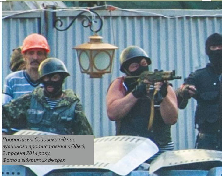
Проросійські бойовики під час вуличного протистояння в Одесі, 2 травня 2014 року.

26 лютого – мітинги під Верховною Радою АРК: один – проросійських організацій з вимогою не визнавати нову українську владу та звернутися по допомогу до Росії (близько 2 тисяч учасників), другий – місцевих українських патріотів і кримських татар за територіальну цілісність України (зібрав 5–10 тисяч