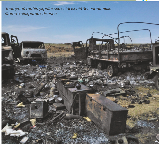
Знищений табір українських військ під Зеленопіллям.

20 червня – Президент України Петро Порошенко оголосив одностороннє перемир'я та закликав до мирних переговорів.