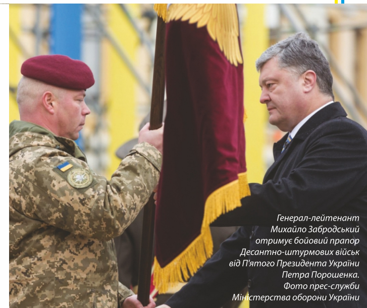
Генерал-лейтенант Михайло Забродський отримує бойовий прапор Десантно-штурмових військ від П'ятого Президента України Петра Порошенка.

слаблення патріотичних настроїв в українському суспільстві, наприклад, через активне використання міфу про спільне минуле, "старшого брата", ностальгії за СРСР, дискредитації українських героїв та української історії загалом. Росія використовує маніпуляції історією для виправдання і посилення агресії проти України.